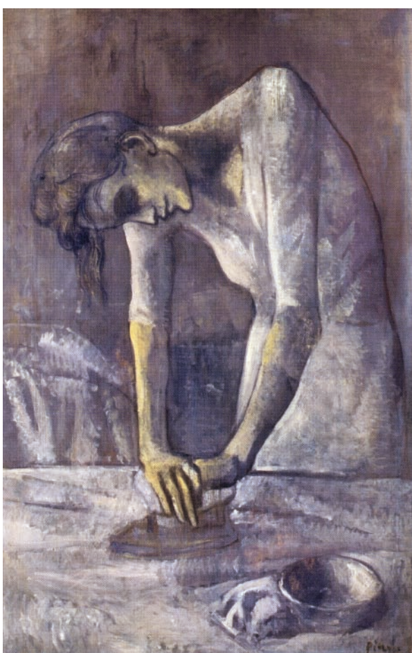
Γυναίκα που σιδερώνει (1904), του P. Picasso, Μουσείο Guggenheim, Νέα Υόρκη.

Οι διαφορετικοί συγγραφείς κινούνται στο ίδιο μήκος κύματος και αλληλοσυμπληρώνονται. Διατηρώντας την αυτονομία τους, ενεργούν συντονισμένα καλύπτοντας ένα ευρύ φάσμα διαφορετικών ομάδων εκπαιδευόμενων. Η επιλογή του κατάλληλου κάθε φορά θέματος και των