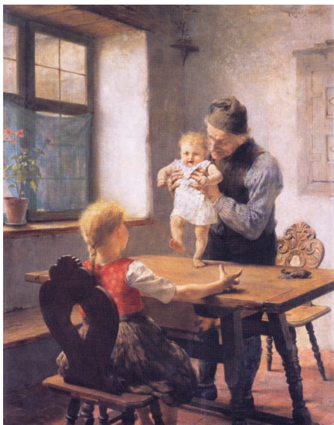
Τα πρώτα βήματα (1889), του Γ. Ιακωβίδη, Πινακοθήκη Ε. Αβέρωφ, Μέτσοβο.

πρακτικές. Μπορεί επίσης να συμβάλει, πέρα από την κριτική προσέγγιση κάποιων θεμάτων, στην ανάπτυξη οριζοντίων ικανοτήτων, όπως είναι οι ικανότητες για κατανόηση πολύπλοκων ή αμφιλεγόμενων καταστάσεων, ανακάλυψη και διασύνδεση των επιμέρους στοιχείων των πληροφοριών, σύλληψη εναλλακτικών λύσεων, ενσυναίσθηση των διαφορών, αναγνώριση