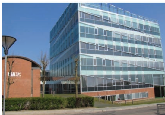
Το κτίριο "Vitus Bering Innovation Park"

κάνει την Πρακτική άσκηση. Εάν ακόμη δε συμπληρωθεί ένας καθορισμένος αριθμός μονάδων ECTS από ένα φοιτητή, προτείνεται να παρακολουθήσει άλλο Τμήμα ή και να διαγραφεί. Η εξέταση γίνεται προφορικά ή γραπτά ή και τα δυο, από επιτροπή καθηγητών, του μαθήματος και ενός εξωτερικού συνεργάτη, από λίστα που υπάρχει στο Υπουργείο, μετά από προκήρυξη.