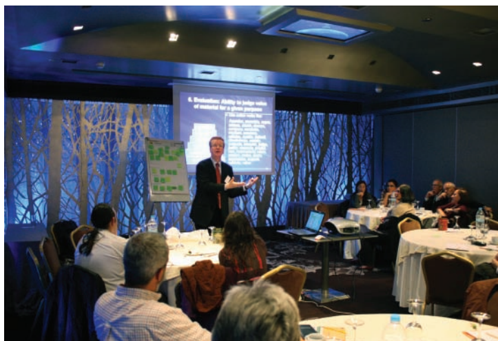
Εικόνα 1: Workshop από την ημερίδα του ΙΚΥ για το ECTS, Αθήνα, Οκτώβριος 2011

και τον όγκο της κινητικότητας των φοιτητών. Το σύστημα αυτό καθιστά εύκολη την ανάγνωση και τη σύγκριση των προγραμμάτων σπουδών, διευκολύνει την ακαδημαϊκή αναγνώριση και βοηθά τα πανεπιστήμια να οργανώσουν και να αναθεωρήσουν τα προγράμματα των σπουδών τους. Τελευταία, το ECTS έχει εξελιχθεί σε ένα σύστημα συσσώρευσης πιστωτικών μονάδων το οποίο μπορεί να εφαρμοστεί σε ιδρυματικό, περιφερειακό, εθνικό και ευρωπαϊκό επίπεδο.