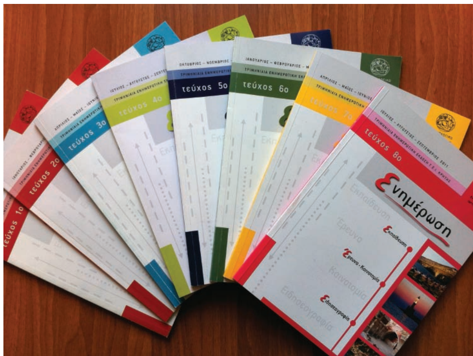
Το περιοδικό «Ενημέρωση»

χους μεταφραζόταν για τον ίδιο σε σκληρή δουλειά και η ικανοποίηση του ήταν έκδηλη μετά. Ωστόσο ποτέ δεν επαναπαύονταν στο γεγονός ότι το κάθε τεύχος ήταν μια ξεχωριστή επιτυχία. Συνέχιζε τη δουλειά πάνω στα μελλοντικά τεύχη μέχρι και το Δεκέμβριο του 2011, το χρονικό σημείο που αντιμετώπιζε σοβαρές επιπλοκές στην υγεία του. Το 10ο τεύχος του οποίου η έκδοση ετοιμάζεται και θα εκδοθεί μετά το Μάρτιο του 2012, έχει προεργασία του ίδιου του Αντιπροέδρου.